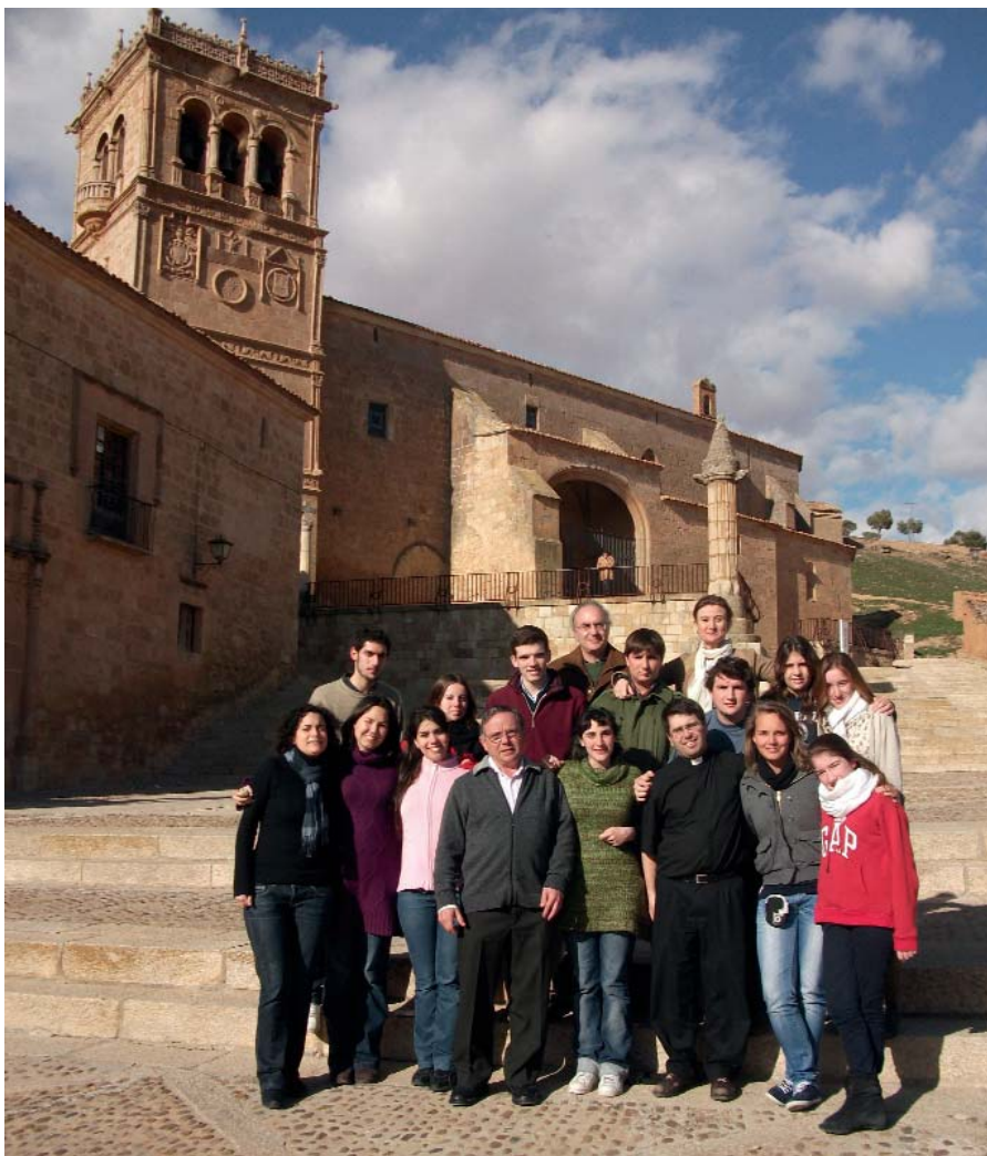
Los Jóvenes de Acción Católica, su sacerdote y el seminarista junto con el Párroco de Morón de Almazán.

Para nosotros ha sido una experiencia muy enriquecedora. Tanto por la convivencia con los jóvenes de AC y los sacerdotes que los acompañan como por la gente que encontramos en los pueblos. Impresiona cómo agradecen que un grupo de jóvenes acuda a su pueblecito de ocho o diez habitantes para celebrar los Oficios. Y es que algo es seguro: si AC no hubiera ido, allí no se habría celebrado el Triduo. Lejos de creernos imprescindibles, en Soria hemos experimentado la importancia de plantearse una vida de servicio. Y así es como lo han visto los chavales de AC