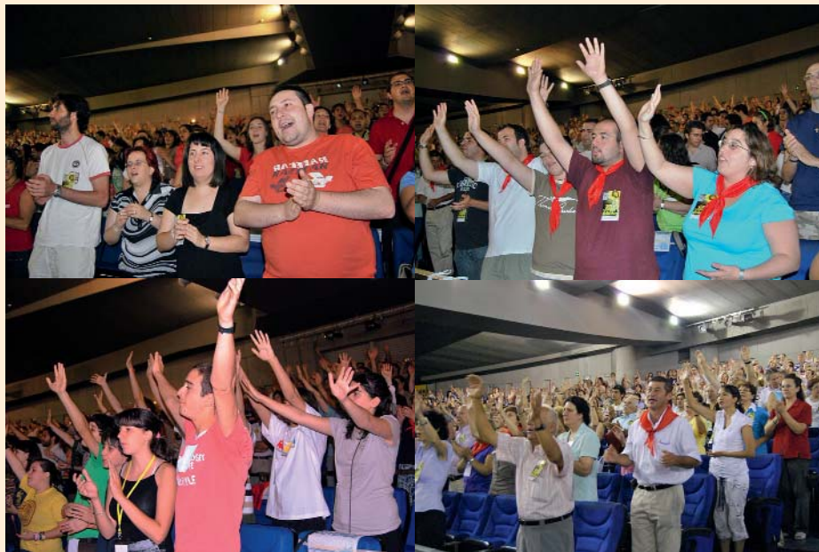
Varios momentos de la Asamblea Nacional de La Renovación Carismática de España.

Decimos que los años actuales son tiempos de crisis y puede que, de tanto repetirlo, empecemos a creérnoslo. Pero no lo son más que otros pasados en los que el Señor se ha servido de la misma