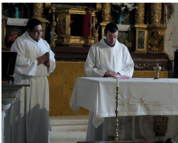
Dos seminaristas celebrando la Liturgia de la Palabra

En definitiva, para nosotros que nos preparamos para ser un día sacerdotes, es un gran testimonio el de todas estas personas, sacerdotes y laicos, que sabemos que rezan y se esfuerzan para que un día nosotros podamos entregarnos del mismo modo, como Jesucristo, sin medida.