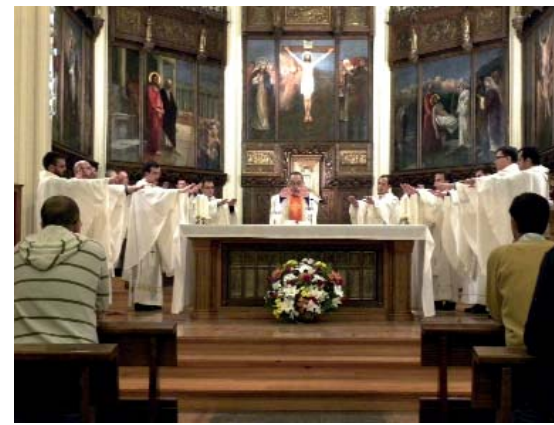
Los nuevos presbíteros celebrando la misa de acción de gracias en la capilla del Seminario Conciliar de Madrid

También en la homilía se les recordó la responsabilidad a la que están destinados ahora: “Los sacerdotes son el amor del corazón de Jesús. Eso vais a hacer, eso sois vosotros; la explicación es clara y fácil de entender: sois el amor del corazón de Jesús porque vais a llevar a los hombres la palabra del Amor que es Él, y lo vais a hacer además en su persona, en su nombre, como si Él fuese el que hablase a los hombres, dirigiéndose a ellos.