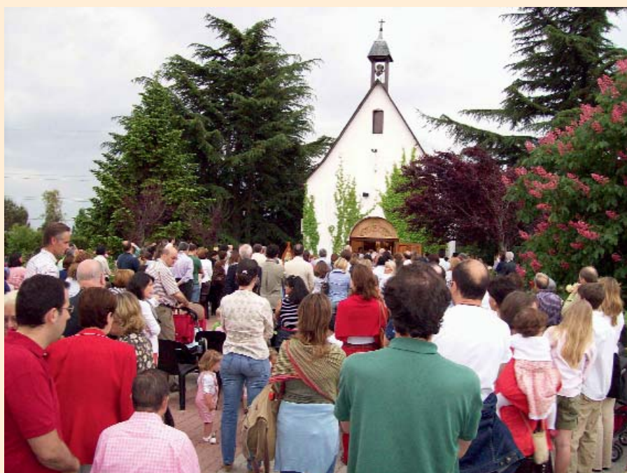
Una Eucaristía en el Santuario Mariano de Schönstatt en Pozuelo de Alarcón

comunidades son hoy signo luminoso de la belleza de Cristo y de la Iglesia” y esta belleza tiene como importante manifestación la comunión entre los distintos Movimientos que se saben parte de la estructura viva de la Iglesia y se empeñan en una labor formativa en el inmenso panorama de la vida del cristiano. La comunión con el sucesor de Pedro y con los obispos potencia al máximo la eficacia apostólica de la Iglesia; todos a una emprendemos la misma tarea de llegar a todo el mundo por todos los caminos y maneras posibles.