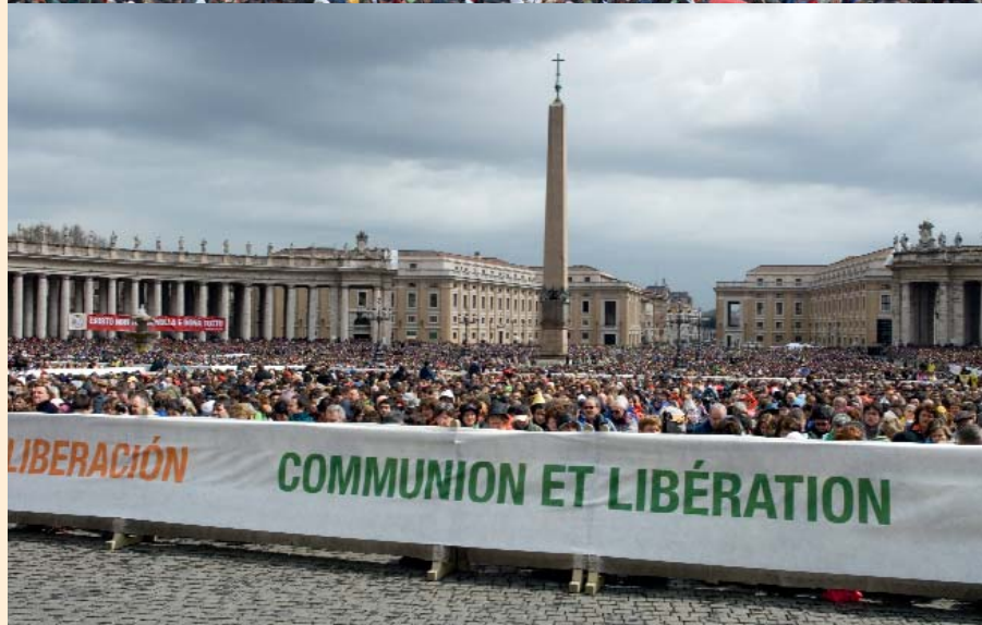
Encuentro de Benedicto XVI y Comunión y Liberación en Roma en el año 2007