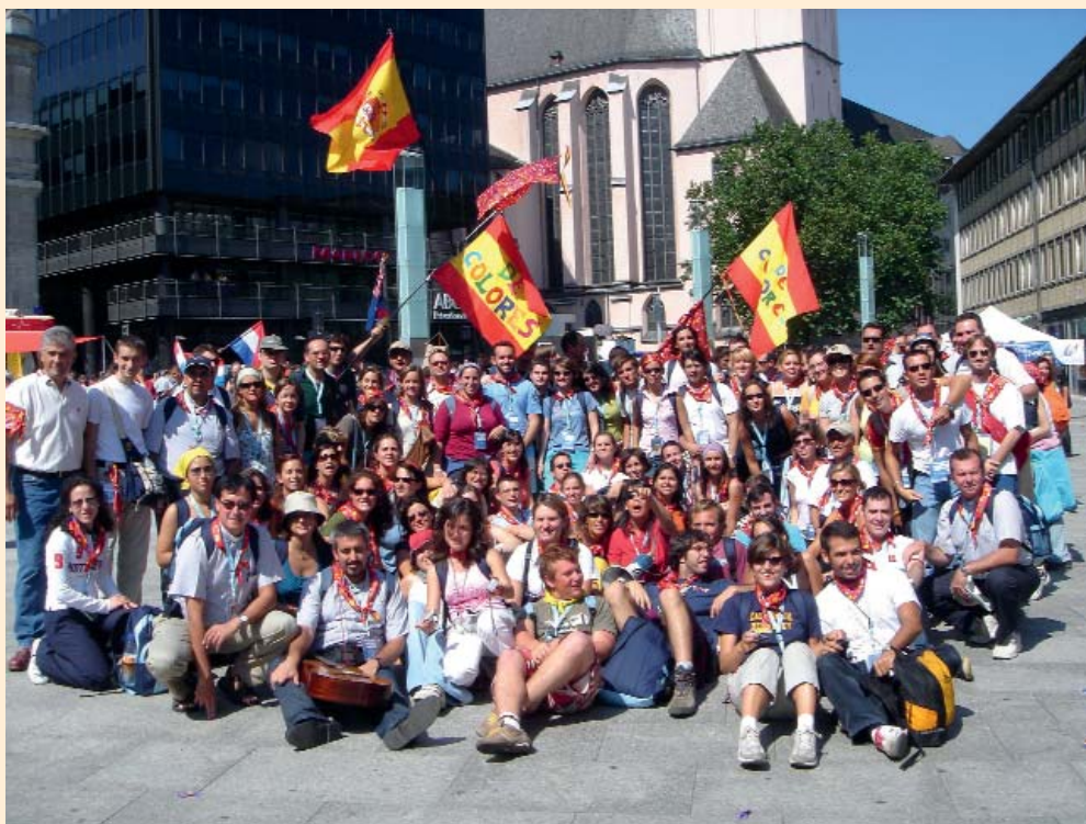
Un grupo de jóvenes de Cursillos de Cristiandad en la JMJ celebrada en Colonia en 2005.